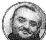
ROBERTO ZOLLO SCUOLA PRIMARIA