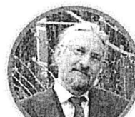
MASSIMO TAVOLA SECONDARIA DI PRIMO GRADO