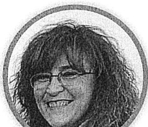
MARIANGELA MAPELLI SCUOLA PRIMARIA