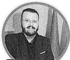
GIUSEPPE FAVILLA SECONDARIA DI SECONDO GRADO

DOCENTI, ATA, INSEGNANTI DI RELIGIONE PER LA SCUOLA